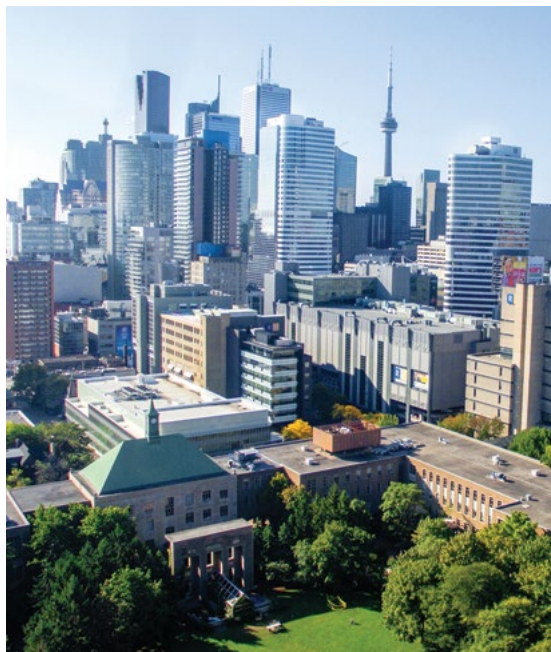
多伦多：全球十大最宜居城市。